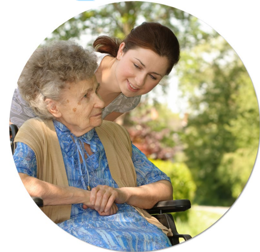
Versorgung spezifischer Patientengruppen