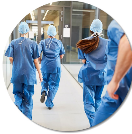
Enge Verzahnung ambulant stationär z.B. im Notfallsetting