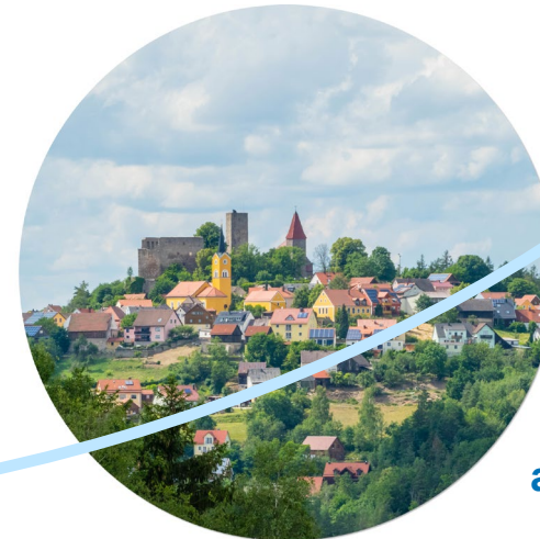
Versorgung ausgewählter Regionen